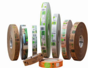
Banderole z nadrukiem - z papieru i tworzyw w różnych szerokościach